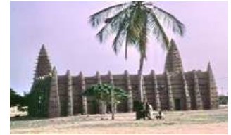
La Mosquée de Almamy Samory Touré construite en terre a plus de 300 ans