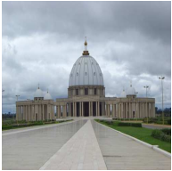
La Basilique de Yamoussoukro, représente le symbole du christianisme

« ... On rencontre toute sorte de religion: Christianisme, l'Islam, Rose Croix, Budéisme... »